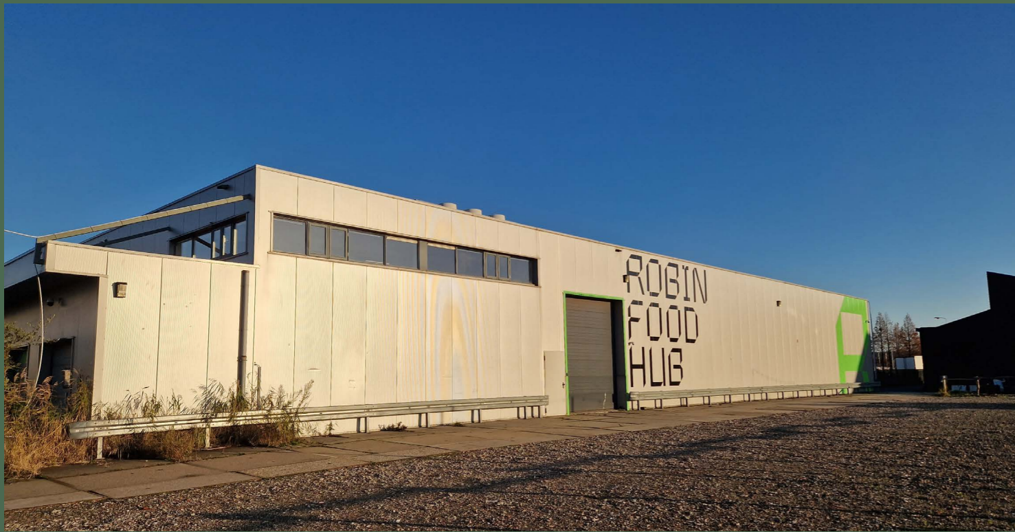
Achterkant Robin Food Hub