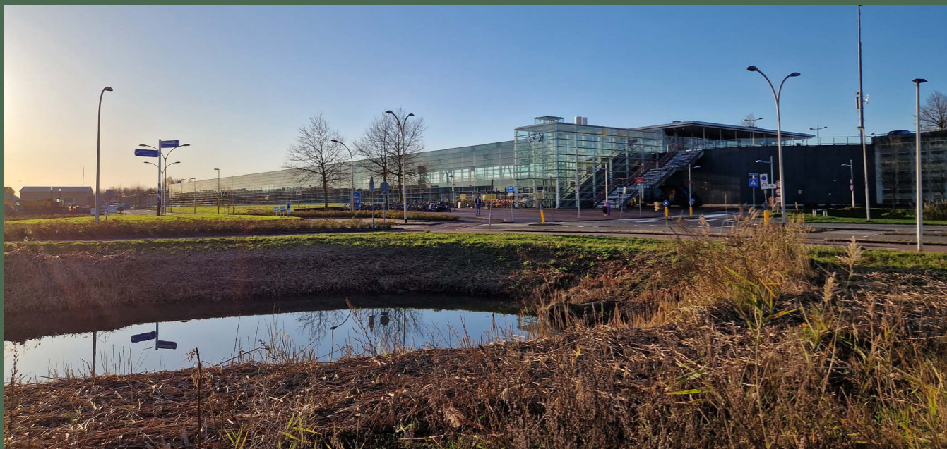
Ligging naast Station Barendrecht